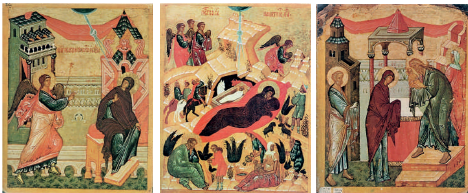
Ил. 7–9. Благовещение (НГОМЗ). Рождество Христово (ГТГ-Ф). Сретение (НГОМЗ). Новгород, конец XV в. Источник: Лазарев 1977.

жать их на руках 12 , возможно, поднимать над головами, имитируя нахождение над толпой выносных икон на древке. Площадь за алтарём Св. Софии в момент свершения действия являла собой единый пространственный образ будущего Второго Пришествия, где Христос и его святые представляли на иконах, а явившееся на Суд человечество – новгородским людом 13 . Данное литургическое приобщение паствы будущему всемирному событию должно было полностью соответствовать исполнению задачи по укреплению в народе православной веры, то есть, по замыслу владыки Геннадия, стать средством борьбы с еретиками.