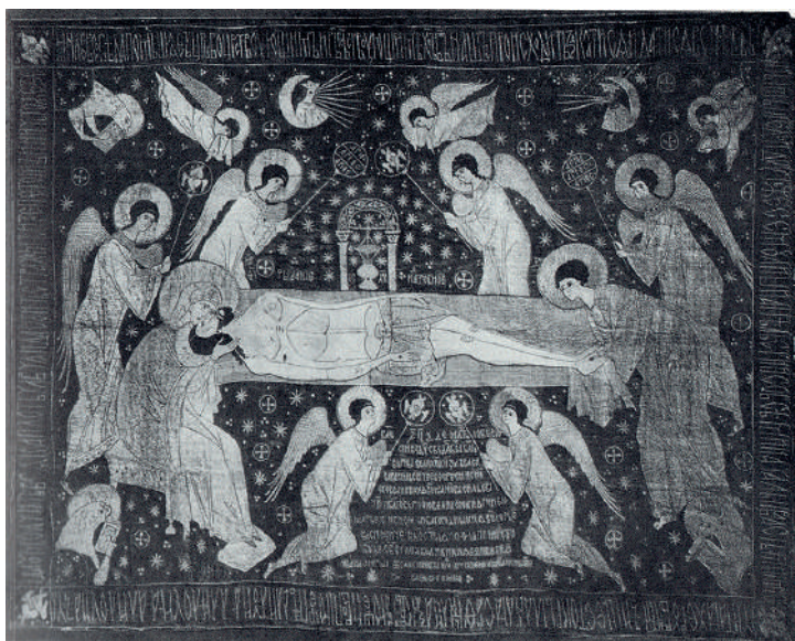
Ил. 15. Плащаница. Москва, 1456 (НГОМЗ).

ство скорбного апофеоза Спасителя. Надмирный характер сцены передают и хрупкие вытянутые фигуры Христа, Богоматери, Иоанна и ангелов, лишённые всякой весомости и материальности, обозначенные лишь сиянием золотой нити, выводящей их контуры и складки одеяний. Центричность композиции, округлость очертаний фигур и крыльев, россыпь звездообразных форм создают эффект вращения как бы реющих вокруг Христа фигур 15 – эффект, который усиливался при колебании ткани плащаницы при её выносе на головах священнослужителей из жертвенника в наос и возложении на гроб. В этот момент под куполом Св. Софии возникал пространственный образ явления небесного земному человеку.