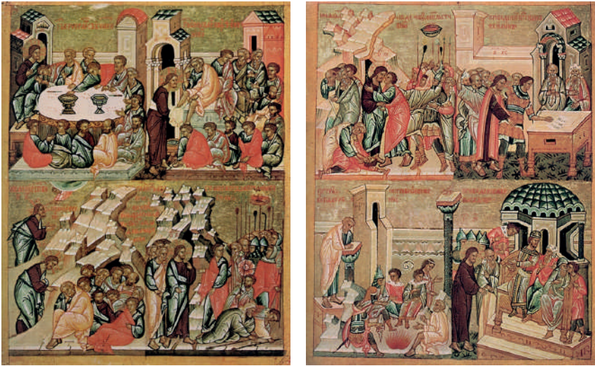
Ил. 10–11. Тайная вечеря; Омовение ног; Моление о чаше; Предательство Иуды (НГОМЗ). Целование Иуды; Христос перед Каиафой и Анной; Отречение Петра; Христос перед Пилатом (ГТГ). Новгород, конец XV в.

Участие большинства софийских икон-«полотенец» в песенных последованиях на Новолетие, в Неделю о страшном суде, в Неделю православия и в Царских часах предполагалось, без сомнения, уже при заказе серии, состав и организация которой должны были учитывать содержательную сторону этих чинов. В византийском искусстве можно выделить сходные по организации с софийской серией сюжетные полиптихи XI–XII вв. в собрании монастыря Св. Екатерины на Синае, исполненные в Константинополе или повторяющие столичные произведения [Евсеева 2013, 15–81]. Допустима мысль, что их сложная организация является отражением участия неизвестных нам серий икон в богослужебном обиходе Св. Софии Константинопольской, в первую очередь при свершении песенных последований. И таким образом источник новгородской серии может быть связан путём долгих повторений и определённых изменений с главным храмом Империи.