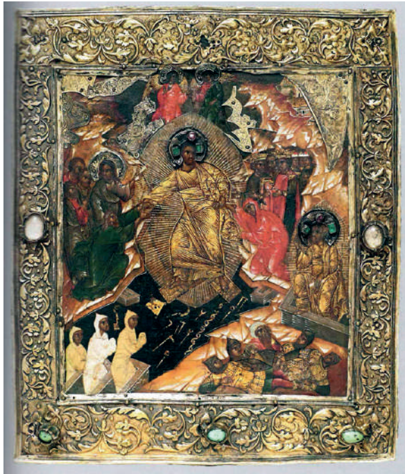
Ил. 17. Воскресение Христово (Сошествие во ад). Москва, первая половина XVII в. Архангельский собор Московского Кремля.

и <...> в олтарь сносят и как начнется целование в олтари минейный образъ тогда на налой пред государя поставят <...> ключари же всем властемъ инемъ образы раздают приисканы ис старых ис полотенец» [Там же, 117–126]. Безусловно, речь идёт об образах «Воскресение Христово», которые, как считалось, должны были находиться на пасхальной заутрене перед глазами каждого православного христианина. Следовательно, согласно тексту «Указа», образ на аналое среди церкви переменялся за время служб Великой Пятницы и Великой Субботы несколько раз, отмечая определённые значимые моменты чинопоследования и передавая его суть. К началу пасхальной заутрени на аналое «среди церкви» выкладывается икона «Воскресение Христово (Сошествие во Ад)» (ил. 17). Этот образ в середине церкви на аналое служил для паствы не меньшим откровением, чем возгласение священника «Христос воскрес!». И каждый из находящихся в соборе приклонялся перед образом и касался его устами 18 .