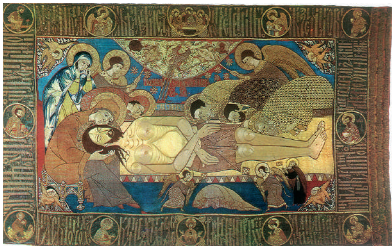
Ил. 16. Плащаница. Москва, 1561 г. (СПМЗ).

в Успенском соборе в момент чтения 12 Евангелий на одном аналое находилась икона «Распятие», а на другом – «Страсти Господни», как это было и в новгородской Софии.