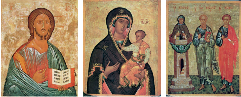
Ил. 4–6. Христос Вседержитель (ГТГ). Богоматерь Одигитрия (НГОМЗ). Симеон Столпник, Иоанн Богослов и апостол Филипп (НГОМЗ). Новгород, конец XV в.

После утрени, как сообщает Чиновник новгородского собора 1626–1634 гг., «ключари устрояют место, на нем лето начинать, и поставят налоги подь иконы и под евангелие <...> а [в церкви] повелевають городским попам поднимать рипиды, крестъ выносной и образы Софеи и Знамениа и пресвятые Владимирския и Тихвинския и налойные полотенца» [см.: Голубцов 1899, 1–2]. Клирики с крестом и иконами торжественной процессией выходили из храма, кресты и выносные иконы во время свершения чина держали в руках, а «полотенца» выкладывали на аналои стороной с изображением Христа, Богоматери, Иоанна Предтечи, апостолов и других святых, среди которых на центральном месте возлагалось «полотенце» с изображением Симеона Столпника, память которого приходится на этот день (ил. 4, 5, 6). Обратим внимание на организацию серии, которая предусматривала такого рода демонстрацию «полотенец»: на большинстве из них изображения святых находятся на одной стороне, а праздники – на обороте, что давало возможность демонстрировать одновременно весь представленный на них христианский «пантеон». Во время свершения чина святитель произносил молитвы, обращённые к Спасителю, Богоматери и всем святым, а также молитву константинопольского патриарха Филофея, обращённую к Спасителю с поминанием Богоматери и всех святых: «Даждь нам в вере и во единстве крепкомъ круга того прейдти <...> Благоверного царя нашего в православии и правде и здравии соблюди <...> да и мы <...> в благоверии и чистоте поживем» [Голубцов 1899, 12–13].