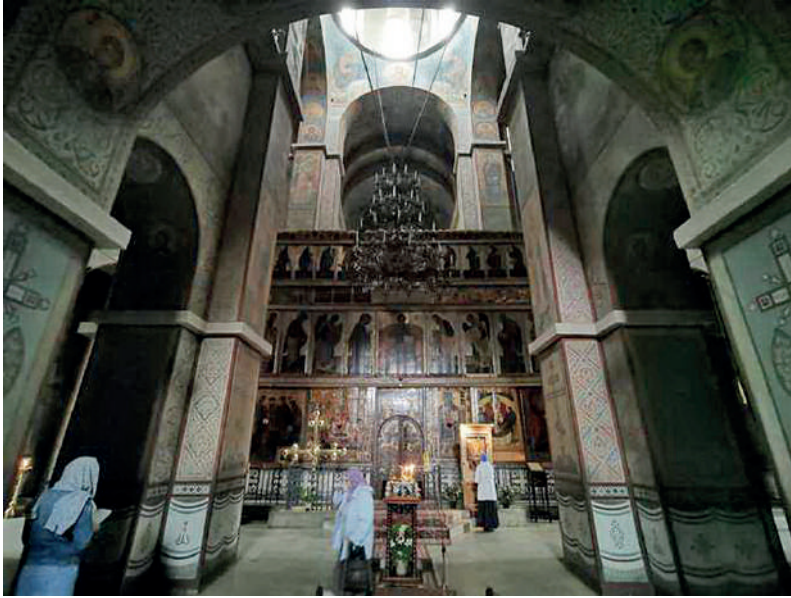
Ил. 1. Собор Св. Софии. Новгород, 1045–1050. Интерьер.