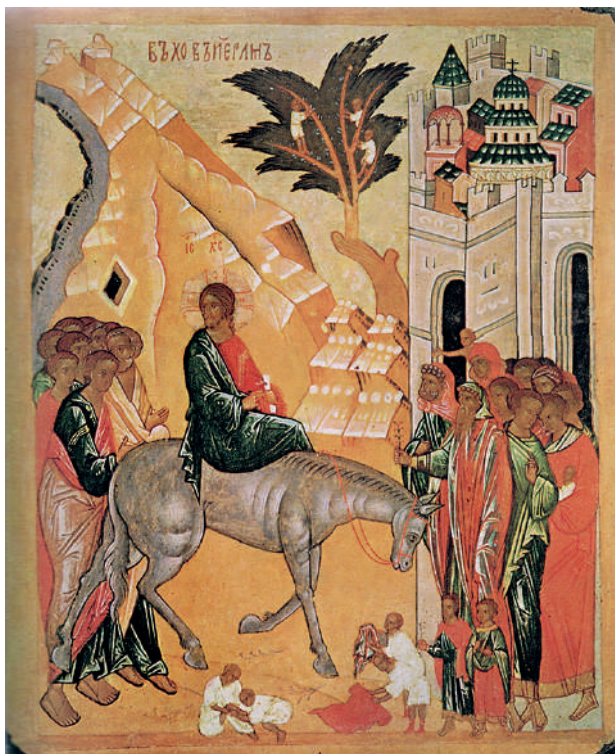
Ил. 3. Вход Господен во Иерусалим (ГТГ). Новгород, конец XV в.

Организация серии аналойных двусторонних икон-«полотенец» в новгородском соборе была такова, что позволяла участие в совершении богослужебных действий целым группам [Евсеева 2013, 347–376], что было новшеством в русской иконописи 10 .