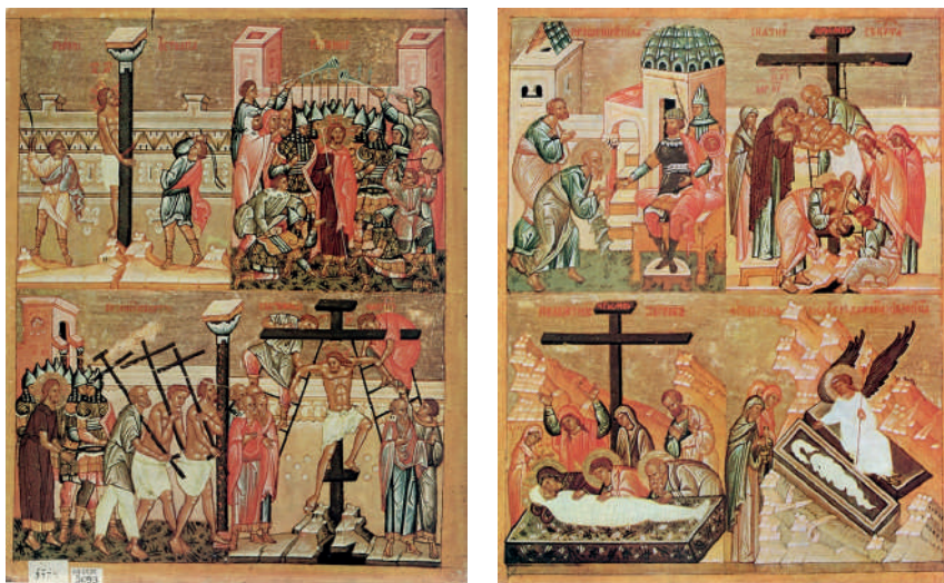
Ил. 12–13. Бичевание; Поругание; Шествие на Голгофу; Восхождение на крест (НГОМЗ). Испрошение тела. Снятие со креста. Положение во гроб. Жены-Мироносицы у Гроба (ГТГ). Новгород, кон. XV в. Источник: Лазарев 1977.

тенцах» расположены так, что продолжением страстных сюжетов на лицевой стороне с «Тайной вечерей», «Молением о чаше» и «Предательством Иуды» являются не сюжеты на обороте таблетки, а сцены на лицевой стороне второй страстной иконки: «Целование Иуды», «Христос перед Анной и Каиафой», «Отречение Петра», «Христос перед Понтием Пилатом» (ил. 10, 11). Дальнейшим продолжением страстного цикла являются сцены на оборотах выложенных на аналое таблеток: «Бичевание», «Поругание», «Шествие на Голгофу», «Восхождение на крест», «Испрошение тела», «Снятие со креста», «Положение во гроб», «Жены-Мироносицы у гроба» (ил. 12, 13). Такая организация сцен на «полотенцах» предполагает по ходу чтения одновременный переворот обоих таблеток на аналое и демонстрацию их оборотов.