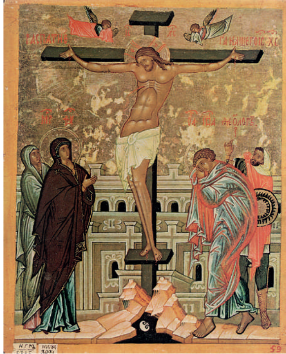
Ил. 14. Распятие (НГОМЗ).

Новгород, кон. XV в.