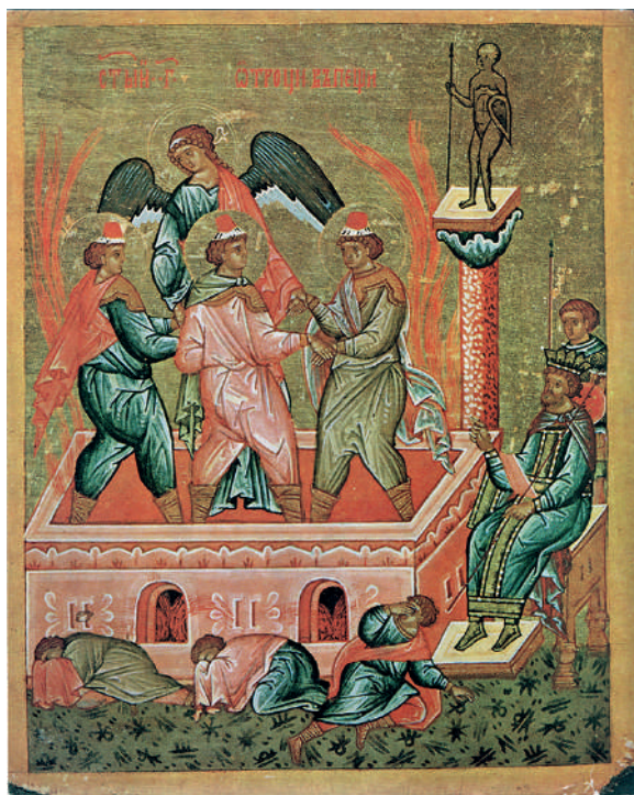
Ил. 2. Три отрока в печи огненной (НГОМЗ). Новгород, конец XV в. Источник: Лазарев 1977.

Одно из наиболее ярких среди песенных последований, свершаемых в соборе, – Пещное действо, названное в тексте Чиновника 1626–1632 г. «Егда ангела спущают...». Оно проходило, как и в константинопольской Софии, в Неделю праотцев (в предпоследнее воскресенье перед Рождеством Христовым) и начинало собой череду служб перед этим важнейшим праздником, когда вспоминались земные предки Христа, пророк Даниил и три еврейских отрока, история которых прообразовывала Воскресение Спасителя. По аналогии со Св. Софией Константинопольской первоначальный престольный праздник новгородского собора, также посвящённого Христу, вероятно, был на Рождество Христово.