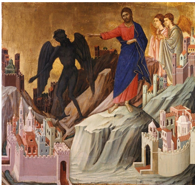
Ил. 7. Дуччо ди Буонинсеня. Испытание Христа на горе. 1308–1311 New York. The Frick Collection.

Во-вторых, стоит вспомнить, что к этому времени в Кремле уже был Анастасис – храм Воскресения, центрическая постройка, согласно летописям, до 1543 года возводившаяся при участии Петра Фрязина (предположительно, вернувшегося на Русь – принудительно или по собственной воле – после известного побега). В. В. Кавельмахер ещё в 1975 году доказал, что разрушенная Наполеоном звонница при Иване Великом появилась лишь во второй половине XVII века. А с 1532 по 1543 годы на этом месте итальянский мастер вёл строительство центрического храма. Именно он и изображён на старых гравированных планах Москвы: «Кремленаграде» (начало 1600-х годов), «Сигизмундовом плане» (1610), Атласе Мериана (1643), «Несвижском плане» (1611) 5 . Поскольку Храм Воскресения над Кувуклией в Иерусалиме тоже центрический – круглый в плане, допустимо предположить, что упомянутый в источниках золотой Гроб Господень, отливавшийся по приказу Бориса Годунова, предназначался для этой, уже возведённой кремлевской постройки.