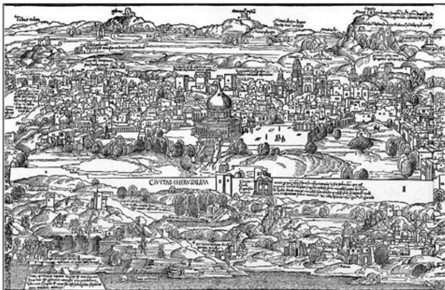
Ил. 4. Храм Соломона в Иерусалиме. Хартман Шедель. Нюрнбергские хроники, 1493. Лист XLVIII