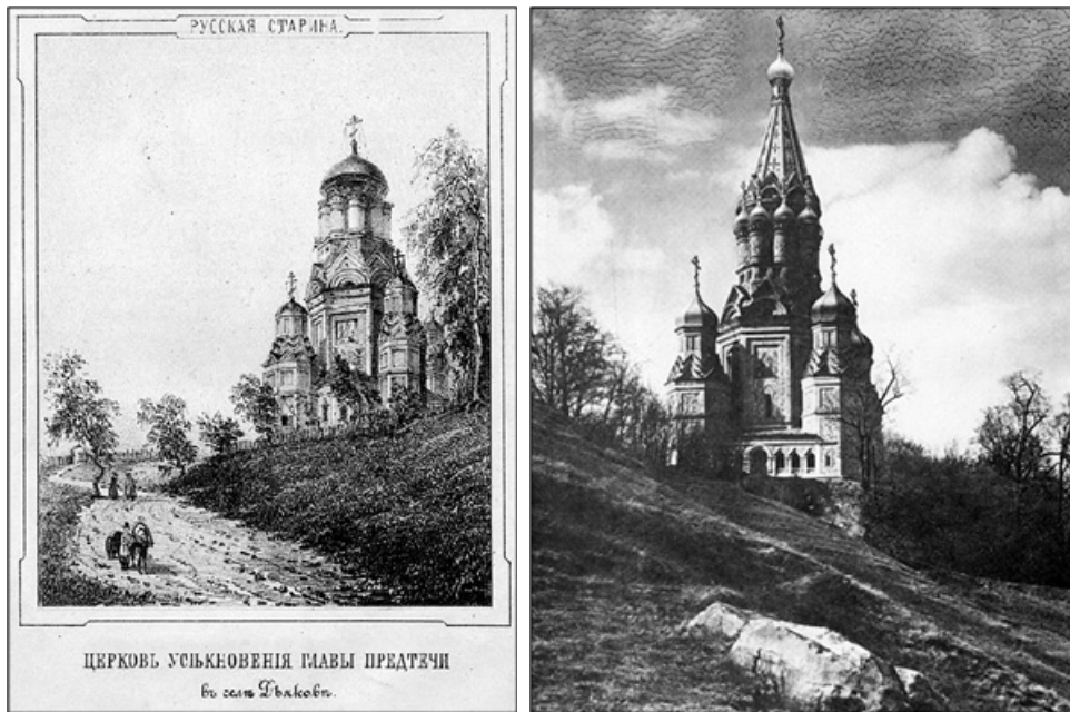
Ил. 1. Церковь Усекновения Главы св. Иоанна Предтечи в Дьякове. Слева: вид храма в сер. XIX в. Справа: Реконструкция М. П. Кудрявцева на сер. XVI в.

сопровождаемую эффектной графикой (ил. 1) гипотезу о том, что на самом деле строительство шатра изначально предполагалось, и лишь волею обстоятельств он был заменён купольным перекрытием 1 .