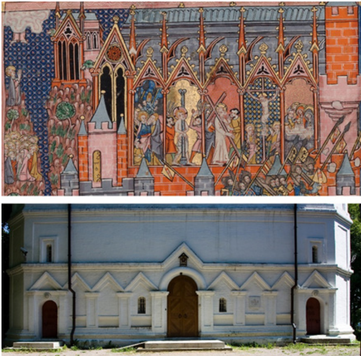
Ил. 6. Щипцы (вимперги) как символическое обозначение архитектуры Иерусалима. Вверху: фрагмент миниатюры «Захват Иерусалима крестоносцами в 1099 году». Historia rerum in partibus transmarinis gestarum Вильгельма Турского (сер. XIV в.). BNF MS FR 352 fol. 62. Внизу: нижний ярус главного фасада церкви Усекновения Главы Иоанна Предтечи в Дьякове.

Но вот в начале книги, на листе XVII, мы видим идеальный город – первый из построенных на Земле после потопа. Он за кольцами стен, с храмом в центре. На храме надпись «Templum Salomonis», внизу у него арочная галерея, а на втором ярусе не простой барабан и не восьмерик, а целый венец экседр (ил. 5). Трудно сказать, почему иллюстрировавшие «Нюрнбергские хроники» (принятое в России название) художники мастерской Михаэля Вольгемута (Michael Wohlgemut, 1434/1437–1519) и Вильгельма Плейденwurфа (Wilhelm Pleydenwurff, ок. 1450–1494) выбрали такую форму: вдохновлялись ли они рисунками, подобными штудиям Леонардо да Винчи, заимствовали ли композицию с вида города Наман (Амман?) из манускрипта Конрада фон Грюненберга [см.: Konrad von Grünenberg 1487] или нашли иные прототипы. Однако представляется, что если бы до Смуты зодчему на Руси поручили использовать данную гравюру в качестве образца, то получившееся здание вышло бы очень похожим именно на храм в Дьякове. «Настроив» зрение на то, что именно изображено его архитектурой, можно увидеть центрический храм, возвышающийся над стенами города. Недаром М. А. Ильин с его замечательной интуицией писал, что эта постройка напоминает замок [Ильин 1980, 56].