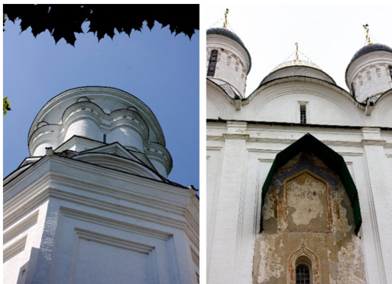
Ил. 8. Профили филёнок в пряслах церкви Усекновения Главы Иоанна Предтечи в Дьякове (слева) и в соборе Рождества Пресвятой Богородицы Пафнутьев-Боровского монастыря (справа).

жественного решения фасадов. Аристотель Фиораванти продолжил древнерусскую традицию, когда прясло – стена между лопатками, поднимающаяся в полукружия закомар – рассматривается гранью общего объёма, его поверхность как бы «растягивается» между опорными элементами. Тремя десятилетиями позже Алевиз Новый предложил иной подход. Лопатки у него превратились в классические пилястры, на них «укладывались» горизонтальные антаблементы, превращая ставшие самостоятельными элементами закомары в подобие огромных декоративных кокошников с возможным заполнением дополнительными украшениями. Плоскости прясел же становились своего рода «картинами», благодаря многоступенчатым филёнкам оформленными в «паспарту». Это делало композицию нарядной и пластически «сочной». К концу царствования Ивана Васильевича этот, второй, подход постепенно становится доминирующим. И, что важно для нас, продолжается и после кончины грозного царя.