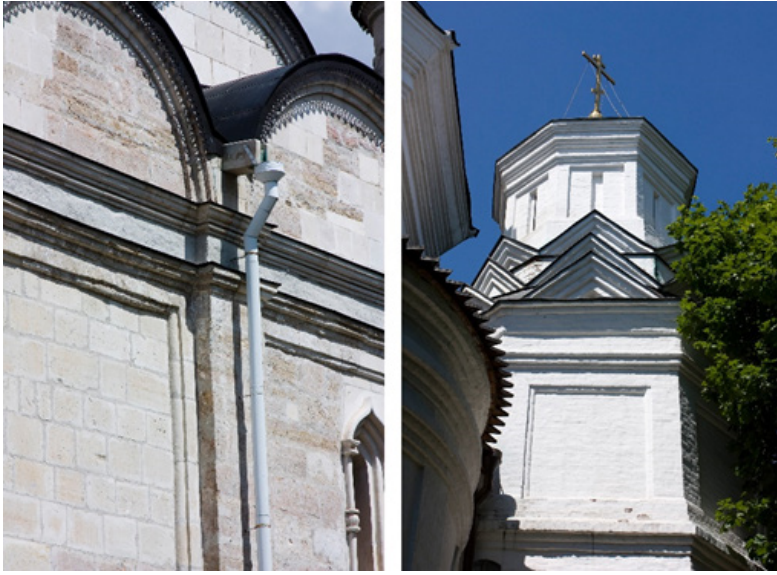
Ил. 9. Профили филёнок в пряслах церкви Усекновения Главы Иоанна Предтечи в Дьякове (справа) и во Введенском храме серпуховского Владычного Введенского монастыря (слева).

кой полосой фриза, во второй половине XVI века стало, по-видимому, восприниматься на Руси как применение дублирующего карниза под главным. Такое же стиливое сходство можно заметить при сопоставлении филёнок малых столпов дьяковской постройки с аналогичными деталями Введенского храма серпуховского Владычного Введенского монастыря (ил. 9), ктитором которого был Борис Годунов. Сходство тем более примечательное, что масштаб в один кирпич выдерживается в постройке из белого камня.