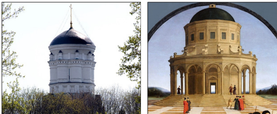
Ил. 3. Слева: верхний ярус церкви Усекновения Главы Иоанна Предтечи в Дьякове.