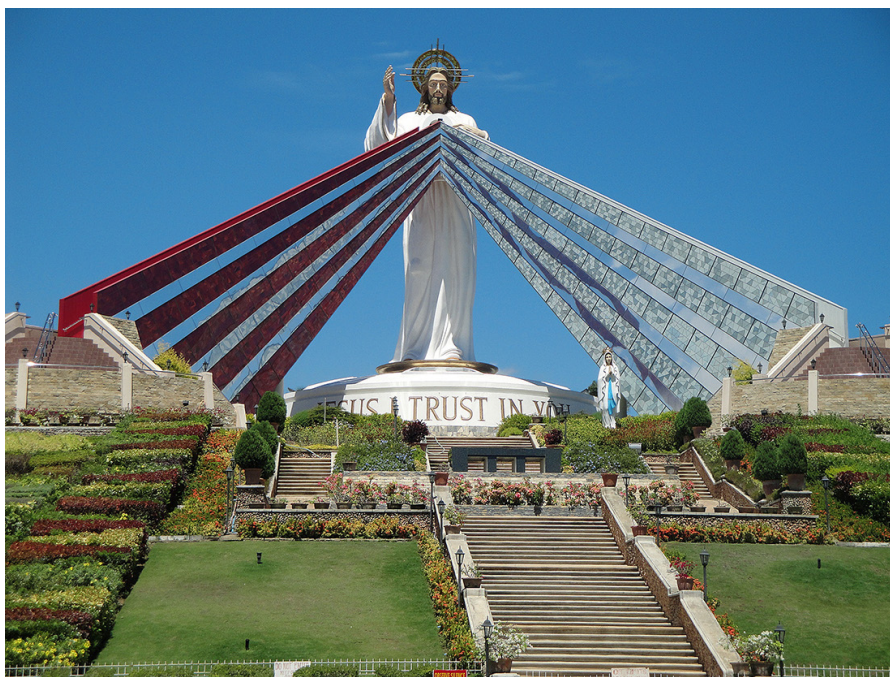
Ил. 4. Санктуарий Божьего Милосердия. Эль Сальвадор, Филиппины.

Художественное описание видения обуславливается своеобразным теологическим предписанием, включающим обязательные характеристики (например, благословляющая рука и два луча, которые исходят из груди), но допускаются разные формы и вариации исполнения этой композиции. К примеру, в Санктуарии Божьего Милосердия в городе Эль-Сальвадор (Филиппины) мы видим не живописное изображение, не картину, а статую (ил. 4).