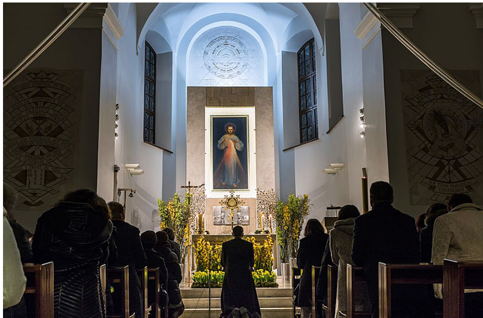
Ил. 1. Вильнюс. Образ Иисуса Милосердного в храме Милосердия Божьего.