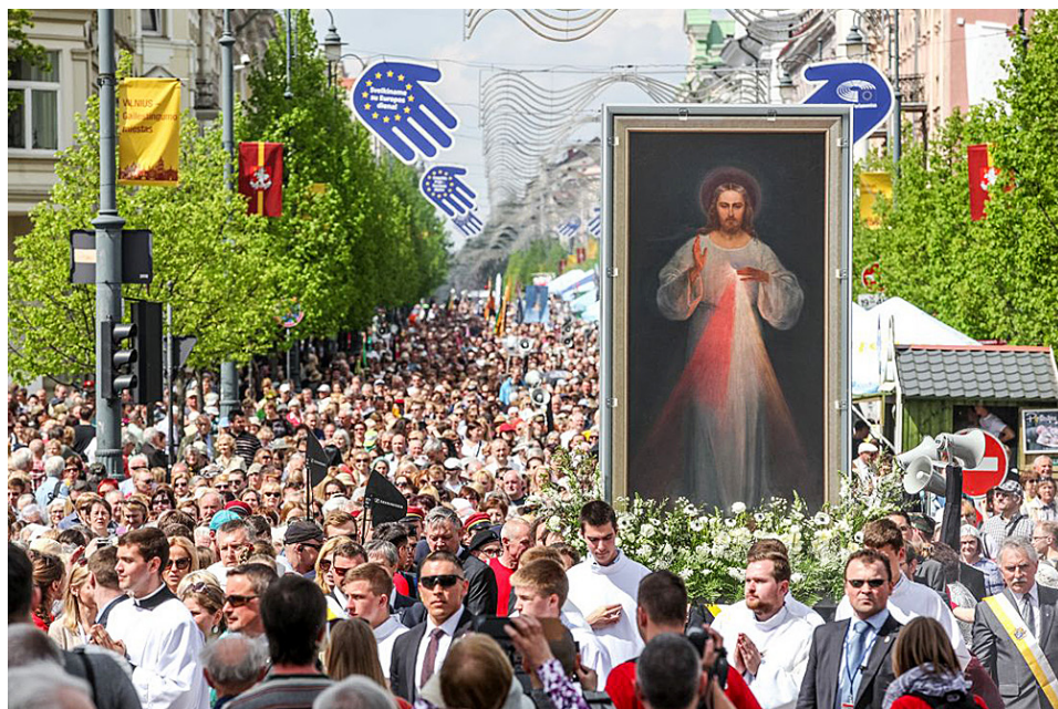
Ил. 2. Вильнюс. Шествие с образом Иисуса Милосердного.