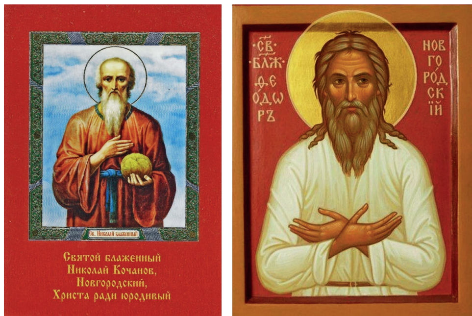
Ил. 2. Святые Никола Кочанов и Феодор Юродивый. Современные иконы.

Блаженный Никола подвизался на Софийской стороне, ходя по улицам и торжищам, проповедуя Слово Божие. В то же время на Торговой стороне юродствовал во Христе Феодор блаженный. Как только один из них видел другого на «своей» стороне, прогонял «супостата», кидаясь в него всем, что «прилучится» на земле. Никола, однажды попав на Торговую сторону, бежал по водам Волхова, как посуху, спасаясь от преследовавшего его Феодора. Подвиг святых становится олицетворением бессмысленной вражды жителей двух «сторон» одного города, зачастую принимавшей ужасные формы.