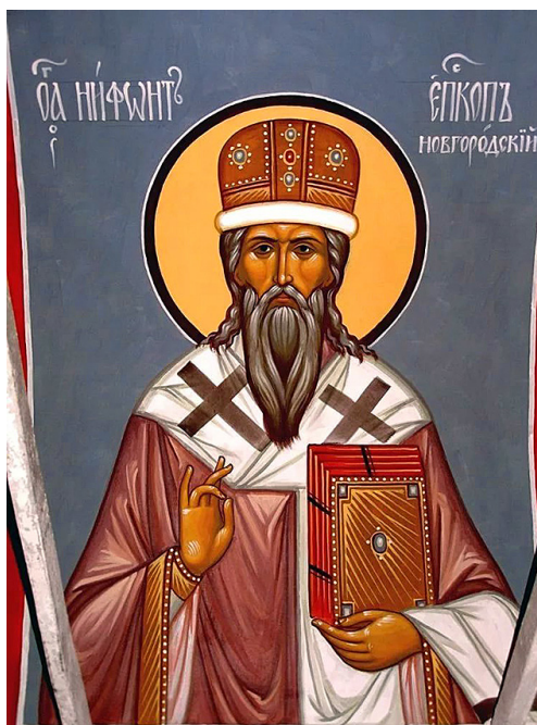
Ил. 1. Нифонт, епископ Новгородский. Современная фреска.

Особый статус Новгорода среди древнерусских городов (прежде всего – вечевой уклад общественного управления) определил специфику местного искусства – вплоть до потери Новгородом своей политической независимости. В агиографии это отразилось прямым изображением исторических событий , связанных с вечевым укладом города. Церковные иерархи были поневоле втянуты в политическую борьбу, и это не могло не отразиться на их духовном подвиге как пастырей, и на рассказе об этом подвиге в житиях святителей. Например, епископ Нифонт († 1156) (ил. 1) в летописи середины XII в. – один, в житиях – совсем иной [Терешкина 2001].