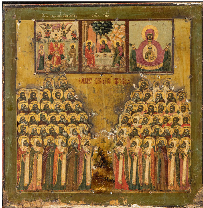
Ил. 9. Собор новгородских святых. Икона. Новгород, 1-я четв. XVIII в.