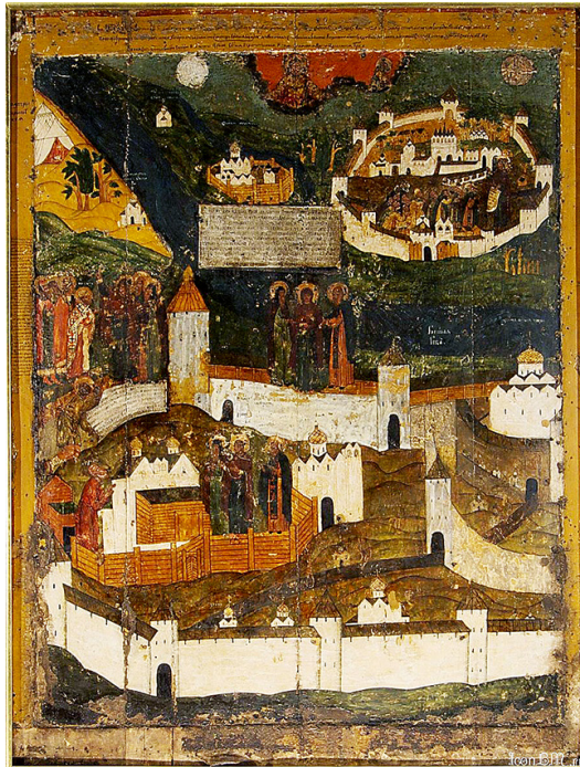
Ил. 7. Видение старца Доротея». Икона. 3-я четверть XVIII в.

ний церкви и населения Новгорода XII в., но и имя владыки, отвечавшего на канонические вопросы автора Вопросания – Кирика Новгородца. Этим владыкой и был Нифонт, который в «Вопрошаниях», как ни странно, выглядит наиболее «человечным»: многое Нифонт прощал своим духовным детям, ибо, вероятно, был мудрым и тонким пастырем в городе, не так давно принявшем христианство, при этом в силу своей образованности и вольнолюбия не принимавшем всё за чистую монету. Примечательно, что вопрошавший к епископу Кирик Новгородец – один из наиболее значимых новгородских (и общерусских) просветителей, так как именно ему принадлежит первый известный на Руси математический трактат «Учение о числах».