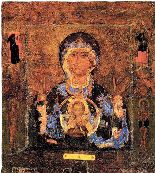
Ил. 4. Знамение Божией Матери. Икона. Новгород, Софийский собор. XII в.