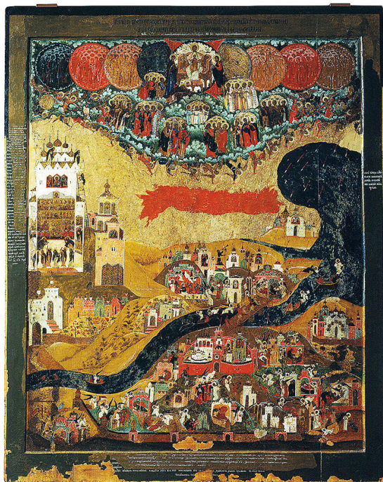
Ил. 8. Видение пономаря Тарасия. Икона. Новгород, вторая пол. XVI в.

В новгородской литературе переключка иконного и литературного образов наблюдается в нескольких сюжетах. Один из наиболее известных текстов – «Видение пономарю Тарасию» – вначале существовал в виде отдельного сказания (и самостоятельного иконного образа) [Дмитриев 1984], а затем вошёл в Распространённую редакцию Жития Варлаама Хутынского.