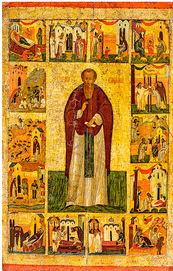
Ил. 3. Варлаам Хутынский с житием. Икона. Сер. XVI в.

и так уже у Бога, нет нужды стремиться исправить его при земной жизни. Так новгородская реальия – Судный мост – становится не только «декорацией» происходящих со святым событий, но и визуализацией сложного этического выбора в ситуации народно-вечевого устройства жизни целого города, веками выработавшего свои социальные и правовые традиции.