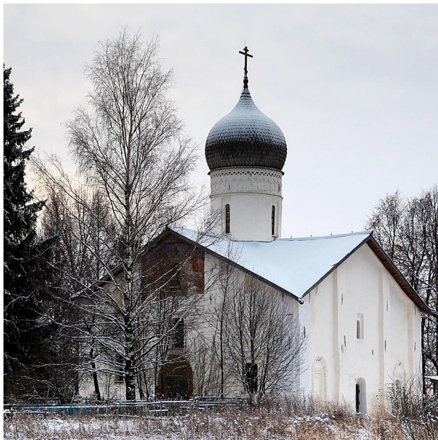
Ил. 5. Церковь Благовещения Богородицы на Мячине (в Аркажах).

Ещё одной новгородской реалией, подтверждающей достоверность чудесного в житиях, является церковь Благовещения в Аркажах (ил. 5).