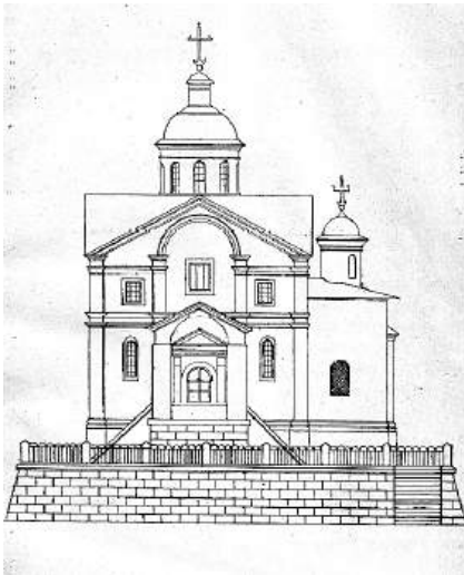
Ил. 9. Москва. Церковь Рождества св. Иоанна Предтечи после перестроек. Источник: Извеков 1913 (слева)

Источник: https://catalog.shm.ru/entity/ОБЪЕКТ/1732609?index=0&paginator=entity-set&entityType=ОБЪЕКТ&entityId=6171669&attribute=like_predm