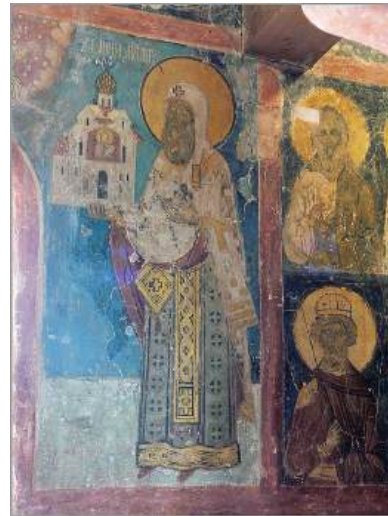
Ил. 10. Архиепископ новгородский Иона. Храм св. Симеона Богоприимца Зверина Покровского монастыря в Новгороде. Фото: С. Аванесов, 2019 (справа)