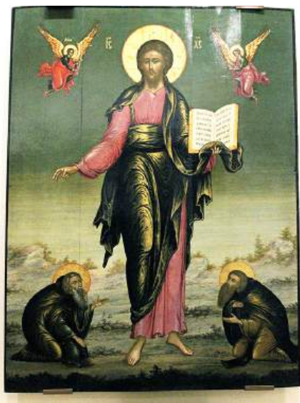
Ил. 24. Спас Смоленский. Москва. Конец XVIII в.

Государственный Исторический музей. Инв. № И VIII 1250.