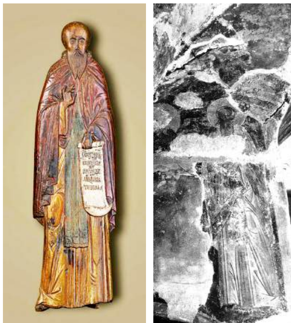
Ил. 6. Преп. Варлаам Хутынский. Резное дерево. Новгород, сер XVI в. Из церкви св. Димитрия Солунского. НГОМЗ, инв. № НГМ КП 4723 ДРД-94. (слева)