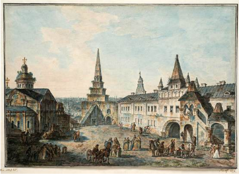
Ил. 8. Фёдор Алексеев. Вид в Кремле на церковь Рождества Иоанна Предтечи, Боровицкие ворота и Конюшенный двор. 1800-е гг. Москва, Государственный исторический музей, инв. № ИР 9814.