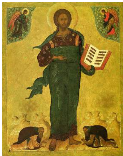
Ил. 22. Икона «Спас Смоленский». Москва, Кремль, Спасская башня.