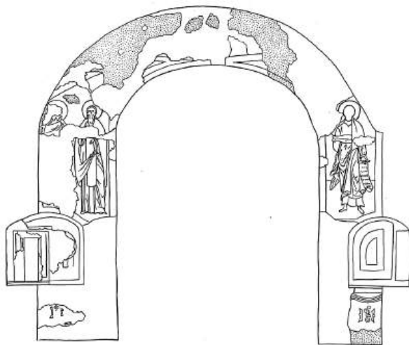
Ил. 5. Храм преподобного Сергия Радонежского. Роспись восточной стены.