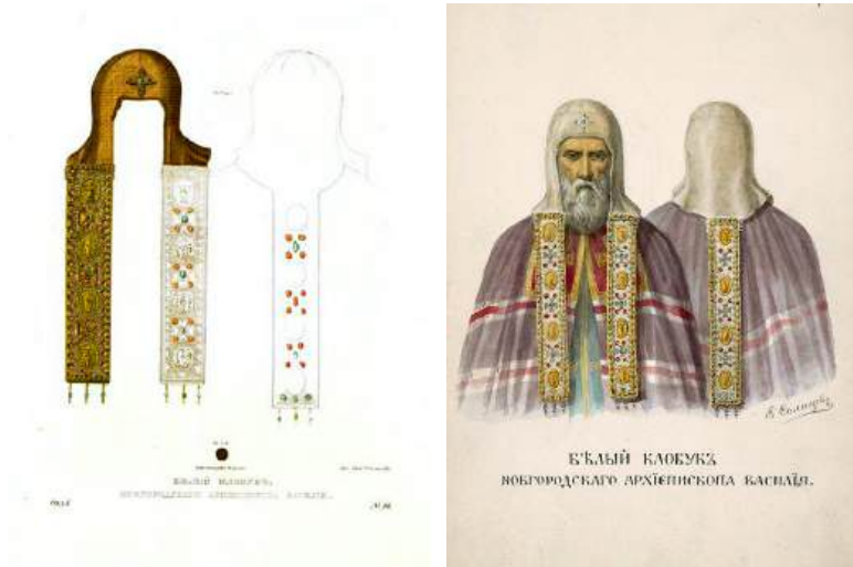
Ил. 13. Белый клобук архиепископа Василия Калики.

Рис. Ф. Г. Солнцева. Древности Российского государства. Отд. 1. Л. 96.