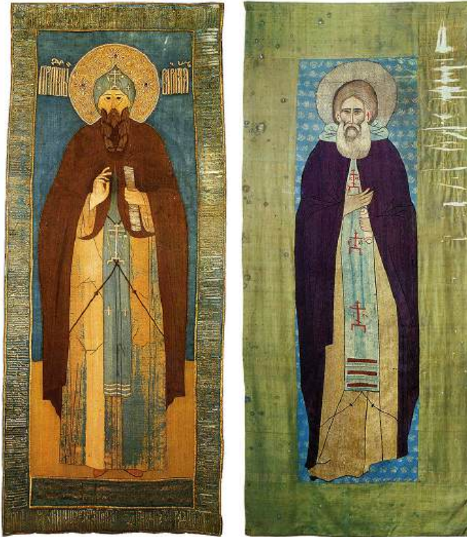
Ил. 1. Преподобный Варлаам Хутынский. Покров. 1579.

Принят к публикации / Accepted 11.08.2024