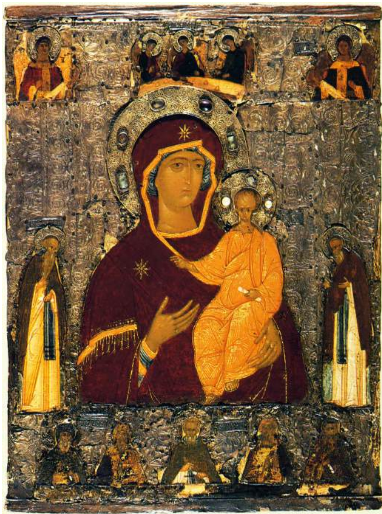
Ил. 15. Богоматерь Одигитрия с Троицей и избранными святыми.

Икона из Троице-Сергиева монастыря. Посл. четв. XV в.