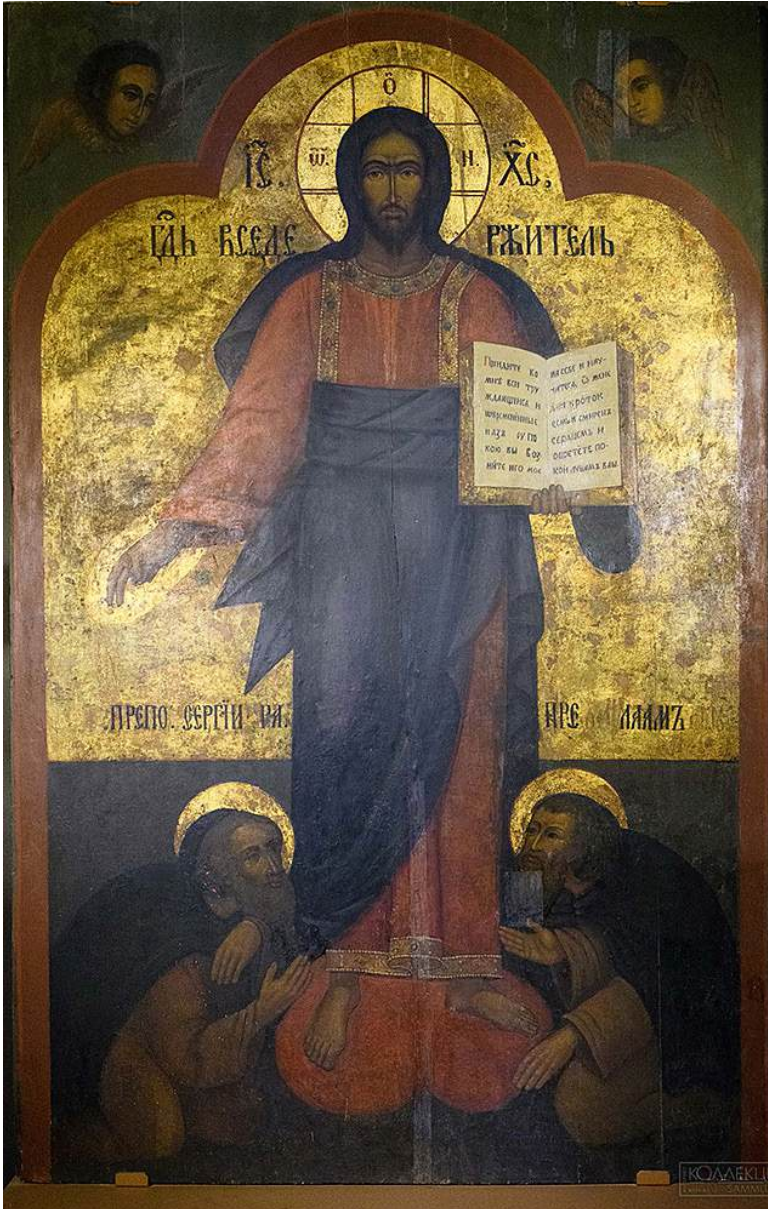
Ил. 17. Икона «Спас Смоленский» из собора Покрова на Рву. Москва, XIX в.