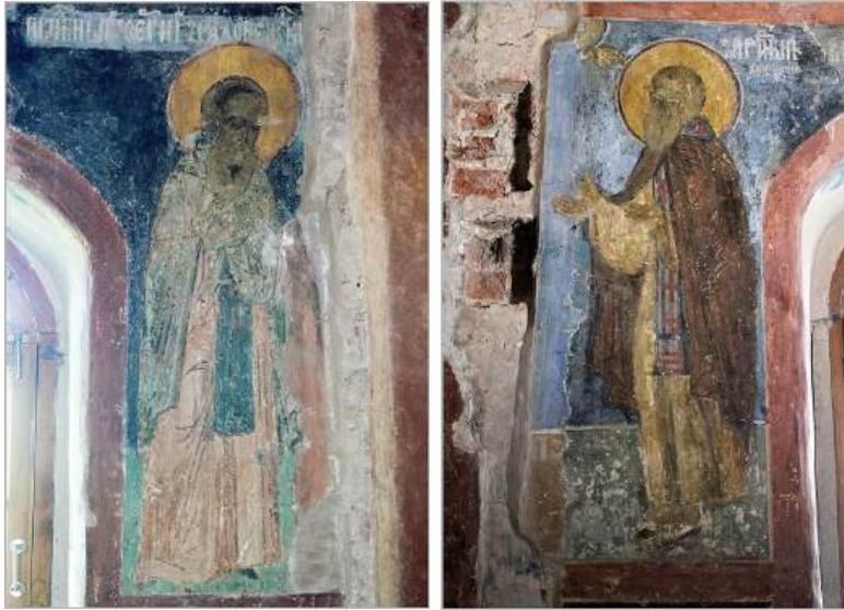
Ил. 11. Преподобный Сергей Радонежский. Храм св. Симеона Богоприимца Покровского Зверина монастыря в Новгороде. Фото: Сергей Аванесов, 2019 (слева)