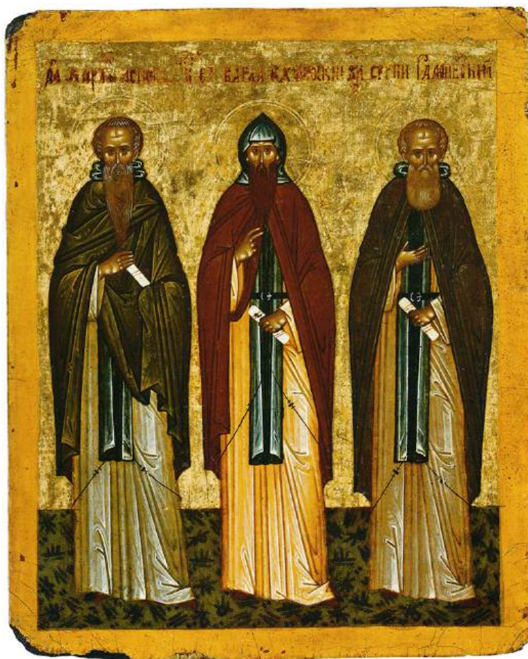
Ил. 16. Преподобные Харитон Исповедник, Варлаам Хутынский и Сергей Радонежский. Новгород, кон. XV – нач. XVI в.