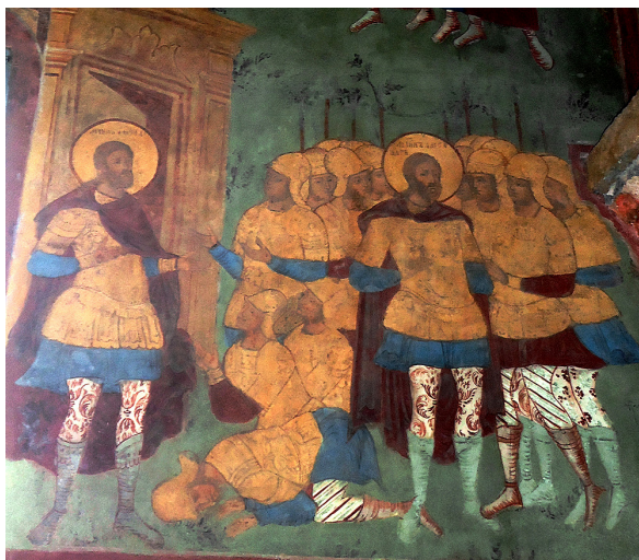
Ил. 6. Житие святого мученика Александра-воина. Фрагмент росписи церкви Ильи Пророка в Ярославле. Около 1716 (?)

Петрович (1690–1718), второй справа – Александр Петрович (1691–1692), сыновья Петра I от первого брака; крайний слева – Пётр Петрович (1715–1719), сын Петра I от второго брака, крайний справа – Пётр Алексеевич (1715–1730), внук Петра I, будущий император Пётр II. Во втором ярусе полуфигуры Михаила Фёдоровича окружают царь Алексей Михайлович и его сыновья от первого брака – царе-вичи Симеон Алексеевич, Алексей Алексеевич и Фёдор Алексеевич. На вершине семейного древа – сыновья Алексея Михайловича от второго брака – царе-вичи Иван (1666–1696) и Пётр (1672–1725), ставшие соправителями после кончины отца и регентами сестры Софьи.