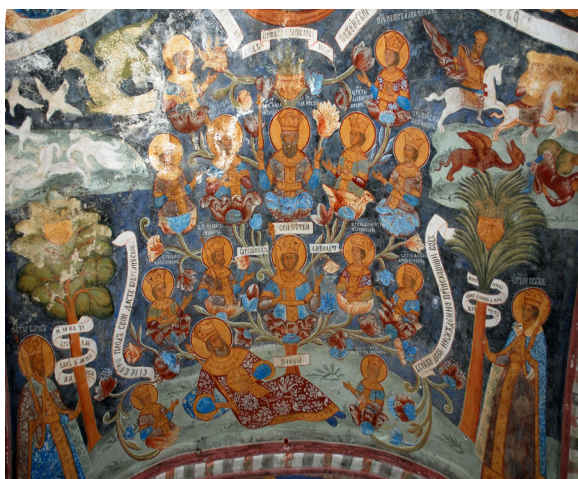
Ил. 7. Род царствия да благословится. Фрагмент росписи церкви Ильи Пророка в Ярославле. Около 1716 (?)