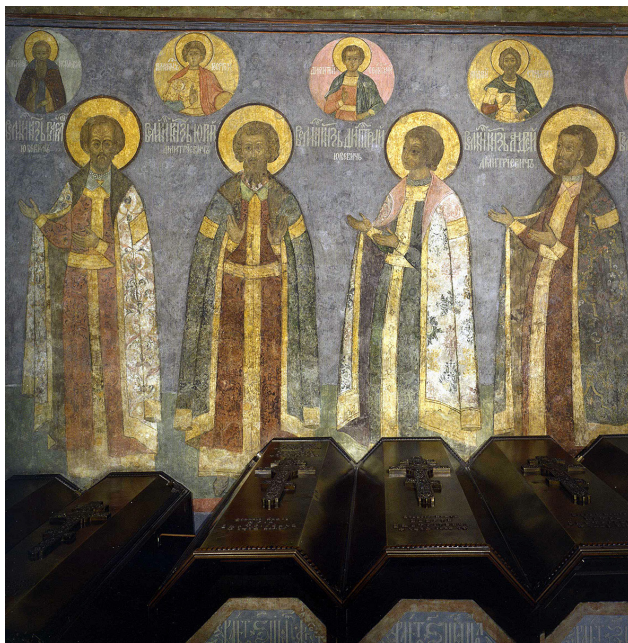
Ил. 1. Великие князья Василий Юрьевич, Юрий Дмитриевич, Дмитрий Юрьевич, Андрей Дмитриевич. Фрагмент росписи Архангельского собора Московского Кремля. 1564–1565

Роспись была выполнена при царе Иване Грозном и должна была показать святость, древность и преемственность государственной власти, а также единство земного и Небесного царства, спасительную роль княжеской семьи как заступников за Отечество перед Небесным Царём.