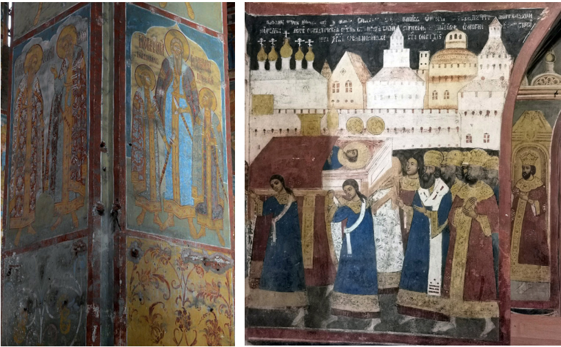
Ил. 2. Ярославские князья Василий и Константин, Муромские князья Константин, Михаил и Фёдор. Фрагмент росписи церкви Николы Мокрого в Ярославле. 1675 (слева)

сцена «Перенесение мощей царевича Димитрия в Москву» (ил. 3), изображающая события 1606 года, когда по распоряжению царя Василия Шуйского мощи царевича были перенесены из Углича в Москву и погребены в Архангельском соборе Московского Кремля. Это должно было доказать, что настоящий царевич действительно мёртв, а новый претендент на престол – самозванец. В росписи, выполненной через сто лет после этих событий, царь Василий Шуйский изображён благоговейно сложившим руки, почтительно шествует за гробом святого царевича, законного наследника престола, последнего из Рюриковичей, смерть которого положила начало Смуте.