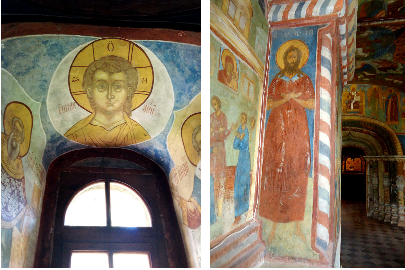
Ил. 4. Спас Эммануил. Фрагмент росписи церкви Николая Мокрого в Ярославле. 1675 (слева) Ил. 5. Преподобный Алексей Человек Божий. Фрагмент росписи церкви Ильи Пророка в Ярославле. Около 1716 (?) (справа)

В этом случае замечательна не только верность ярославцев своим убеждениям, но и смелость эти убеждения визуализировать. В храмовой летописи указано, что церковь «стенным писанием украшена при державе благочестнейшей самодержавнейшей великия государыни наша императрицы Анны Иоанновны вся России самодержицы и преблагословенной государыни и царице Евдокии Фёдоровне» [Макарова 2018, 253]. Публичное упоминание Евдокии Фёдоровны – первой жены Петра I, матери царевича Алексея и бабушки императора Петра II, насильно постриженной в монастырь в 1698 г., бывшей под следствием по делу царевича Алексея в 1718 г., заключённой в Шлиссельбургской крепости в 1725 г. Екатериной I, освобождённой и возвращённой в Москву своим внуком, умершим у неё на руках в 1730 г., – прославление её как «преблагословенной государыни» говорит о глубоком почтении к трагической судьбе последней русской царицы и о признании ярославцами законным только первого царского брака.