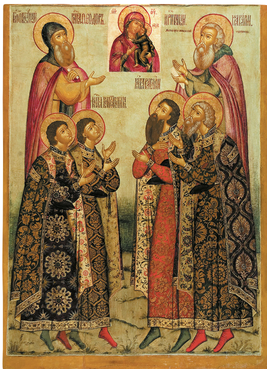
Ил. 10. Святые князья Феодор, Давид и Константин, святые князья Василий и Константин, ярославские чудотворцы, и преподобный Макарий Унженский перед иконой «Богоматерь Толгская». Вторая половина XVII в. Собрание Ярославского художественного музея

Исходя из этого, мастера могли сознательно изменить слово в названии композиции, полностью изменив её смысл: смерть царевичей – наказание за грехи, пресечение династии – справедливое возмездие для всех жителей государства. В то же время прославление святых царского дома служило обращением к Божественному милосердию и свидетельствовало об умерших царевичах как заступниках за Отечество на небесах. Возможно, поэтому престолы в их честь освящались именно в алтарях.