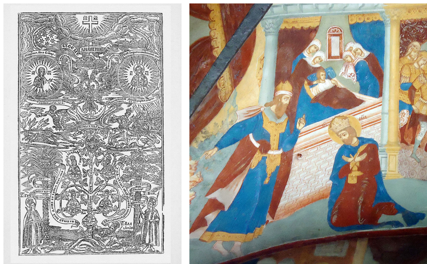
Ил. 8. Род правых да благословится. Гравюра. 1666 (слева)